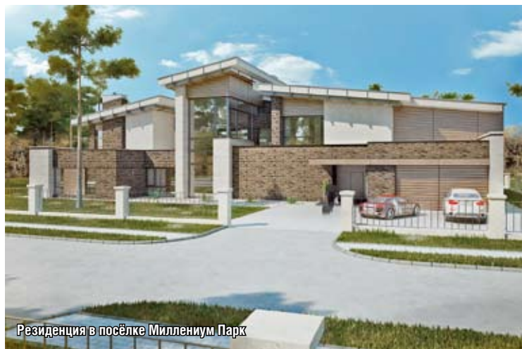
Резиденция в посёлке Миллениум Парк

— Это один из основных постулатов нашей работы. Первое, мы — функционалисты, у нас форма всегда рождается из функции. Дом должен быть технологически абсолютно безупречным. Второе, что для нас важно, как он будет выглядеть через 10-15 лет, поэтому мы продумываем все детали проекта вплоть до того, как материалы будут вести себя спустя долгое время. Наше преимущество в том, что мы занимаемся как крупными объектами, так и «малоэтажками». Новейшие технологии или то, что просто оказывается удачным на больших объектах, мы применяем и на маленьких, и наоборот. К примеру, на небольших частных домах мы применяем последние технологии навесных фасадов, тепловые насосы, зеленые кровли или конструктивные решения, позволяющие воплотить самые смелые идеи. В то же время, проектируя отель