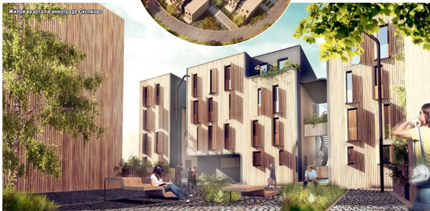
Жилой квартал в иннограде Сколково

жен хорошо понимать, как заказанные «вещи» работают, обосновать свои предложения, объяснить заказчику, почему для него так будет лучше. Если заказчик видит, что архитектор, во-первых, понимает его, во-вторых, может ему что-то, о чем сам не догадался, абсолютно обоснованно предложить, то возникает синергетический эффект, который и позволяет в результате получить хороший продукт. И тогда довольны все — и заказчик, и архитектор.