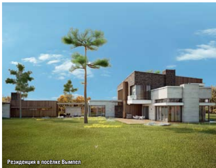
Резиденция в посёлке Вымпел

В России работает достаточно много хороших архитекторов, которые любят и умеют проектировать современную качественную архитектуру. Но такие дома в основном строятся индивидуальными заказчиками — на Рублевке и Новой Риге. Девелоперы не хотят застраивать ими поселки, потому что они дороги по себестоимости, либо принято считать, что рынок к этому еще не готов. С другой стороны, все независимые риелторы, с кем общаемся, жалуются на качество предложения. Однако бывали случаи, когда такие дома появлялись в продаже; с хорошей современной архитектурой, с удобной планировкой, они выде-