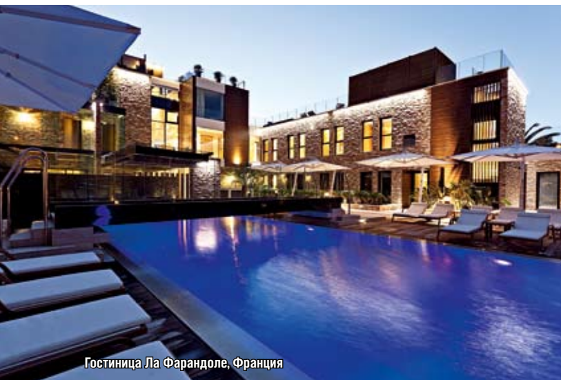
Гостиница Ла Фарандоле, Франция

— Для Сколково мы сделали концепцию жилого района в соответствии с требованиями устойчивой архитектуры. Здания проектировались по принципу пассивных домов с использованием рециклированных стройматериалов, в нашей концепции предусмотрены велопарковки, а также максимально бережное отношение к биосреде. В частности, чтобы не беспокоить птиц и прочих представителей местной фауны, в ночное время верхние светильники на улице отключаются и для освещения дороги используется специальная нижняя подсветка.