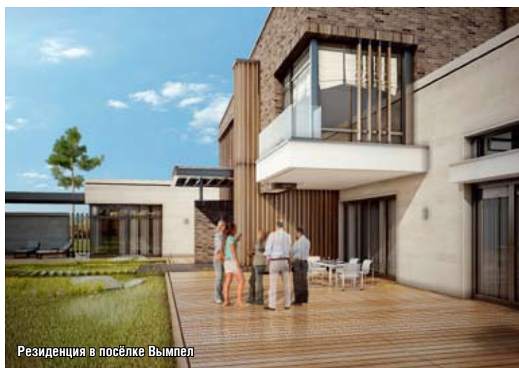
Резиденция в посёлке Вымпел