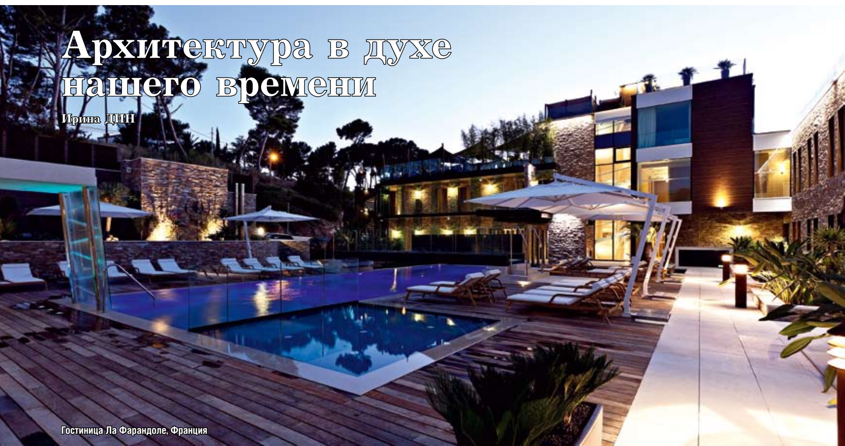
Гостиница Ла Фарандоле, Франция