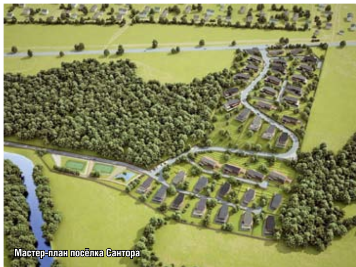
Мастер-план посёлка Сантора

априори стоят недешево, заказчик изначально доверяет этим архитекторам и не имеет намерения серьезно вмешиваться в их работу. Но, с другой стороны, можно сказать, что проблема взаимопонимания между архитектором и заказчиком — внациональная, она возникает в любой стране и касается не только архитектуры, но и любого творческого процесса. Когда заказчик приходит к архитектору, он процентов на девяносто пять уже осознал, что ему нужно. Если бы он понимал это на сто процентов, то, возможно, ему архитектор вообще не понадобился, а достаточно было бы чертежника. Задача архитектора, дизайнера, любого другого креативщика уметь выслушать и четко понять психологию и потребности заказчика, задать ему правильные вопросы, чтобы в результате предложить эти недостающие пять, а может быть и десять процентов. При этом архитектор дол-