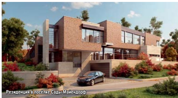
Резиденция в посёлке Сады Майендорф

в Провансе, мы воспользовались нашим опытом создания уютных частных резиденций.