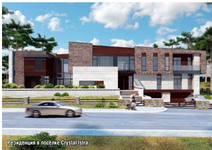
Резиденция в посёлке Crystal Istra