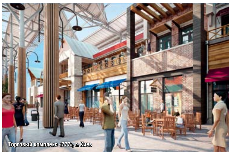
Торговый комплекс «777», г. Киев

лялись из массы «конфекционной архитектуры» и быстро продавались.