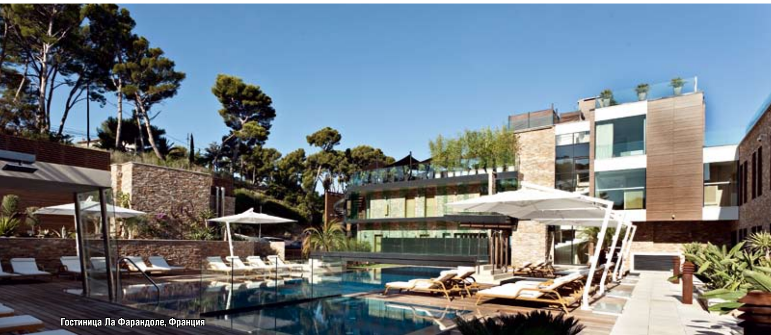
Гостиница Ла Фарандоле, Франция