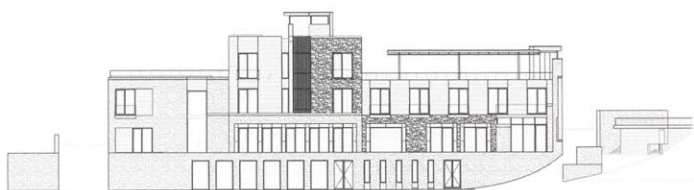
Слева и ниже: фасады и виды в сторону моря