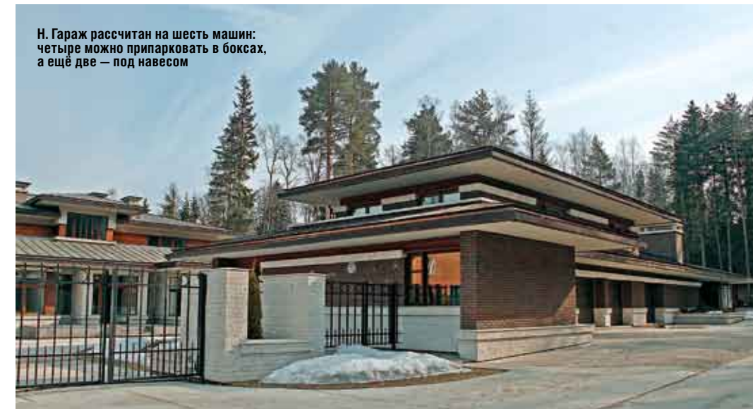
Н. Гараж рассчитан на шесть машин: четыре можно припарковать в боксах, а ещё две — под навесом

сторная кухня-столовая и помещение домашнего кинотеатра, по правую — ансамбль парадной гостиной с музыкальным салоном и столовой, которые разделены каминной зоной. В этом же крыле предусмотрена еще одна, малая гостиная.