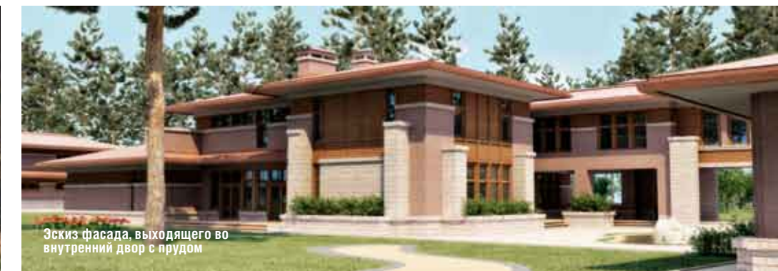
Эскиз фасада, выходящего во внутренний двор с прудом