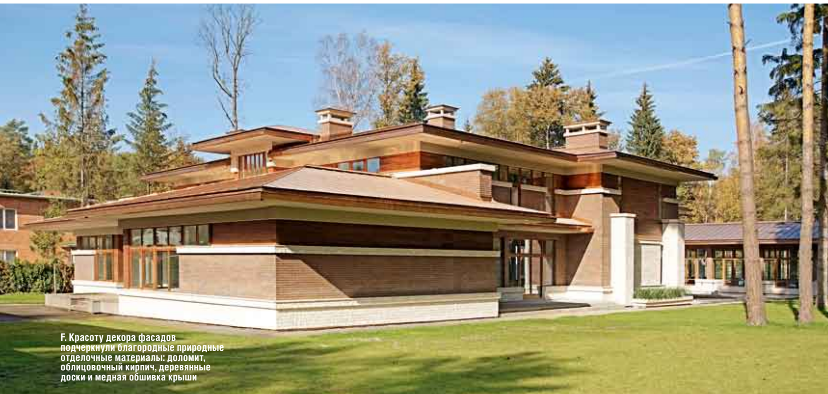
Ф. Красоту декора фасадов подчеркнули благородные природные отделочные материалы: доломит, облицовочный кирпич, деревянные доски и медная обшивка крыши