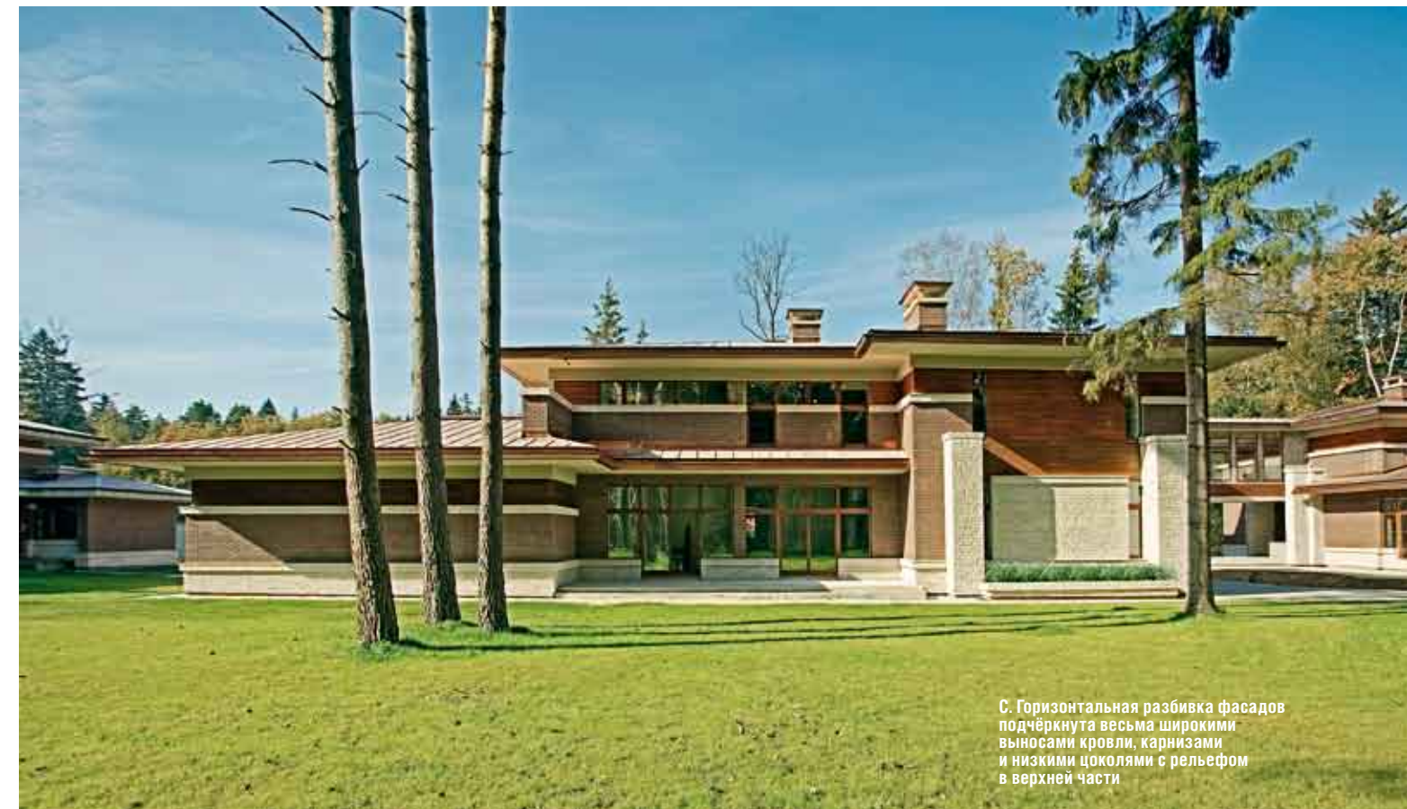
С. Горизонтальная разбивка фасадов подчеркнута весьма широкими выносами кровли, карнизами и низкими цоколями с рельефом в верхней части

сплошное остекление («свет придает красоту зданиям»), используя для этого панорамные окна, предусмотренные не только на фасадах, но и в кровле. При этом его дома дают ощущение надежной защиты и домашнего уюта. Все эти легко узнаваемые черты стали визитной карточкой райтовского стиля, хотя логичнее было бы начинать рассказ о нем с инженерных новаций, перечисление которых могло бы стать отдельной темой для статьи. Самое радикальное среди них, пожа-