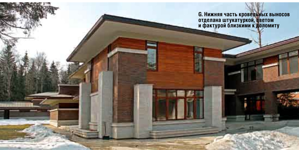
Г. Нижняя часть кровельных выносов отделана штукатуркой, цветом и фактурой близкими к доломиту

гараж рядом с въездом на участок, а от расположенной с противоположной стороны дороги — двухэтажный бассейн, за которым устроен теннисный корт. Планировочными средствами архитекторам удалось сохранить само ценное — ощущение простора и непринужденности, столь необходимые в организации загородной жизни, и потому участок не пришлось обносить глухим забором. Его окружает лаконичная кованая ограда, что позволяет сохранить чувство единства внутреннего двора с окружающим ландшафтом.