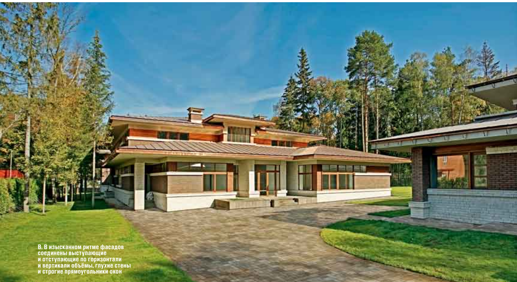
В. В изысканном ритме фасадов соединены выступающие и отступающие по горизонтали и вертикали объёмы, глухие стены и строгие прямоугольники окон