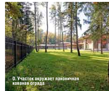
Д. Участок окружает лаконичная кованая ограда

Особенность этого проекта заключается в том, что он представляет собой не отдельно стоящую постройку, а живописно и продуманно организованный ансамбль. Он состоит из трех частей