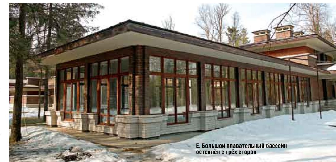
Е. Большой плавательный бассейн остеклен с трёх сторон

С тем же вниманием, с каким к расположению дома относился Райт, продумана пространственная композиция ансамбля. Парадными помещениями главный дом развернут в сторону лужайки и лесистого участка — на юго-восток, что обеспечивает великолепную инсоляцию. От поселковой улицы его отделяет вытянутый >